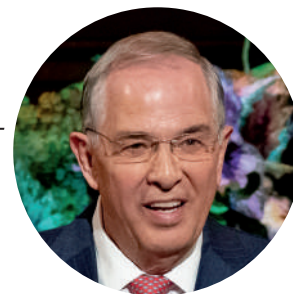
ニール・L・ア ンダーセン長老

このお話の全体は conference.ChurchofJesusChrist.org で見るすることができます。