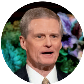
デビッド・A・ ベドナー長老